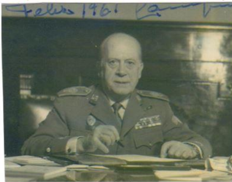
De General de División como Gobernador Militar de Gerona y Madrid.