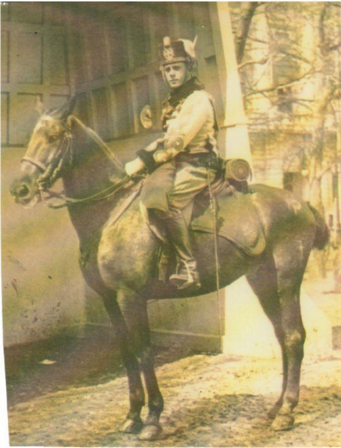
En 1919 en el servicio militar como soldado y luego cabo de Húsares de la Princesa. Fotografía tomada delante del Palacio Real.