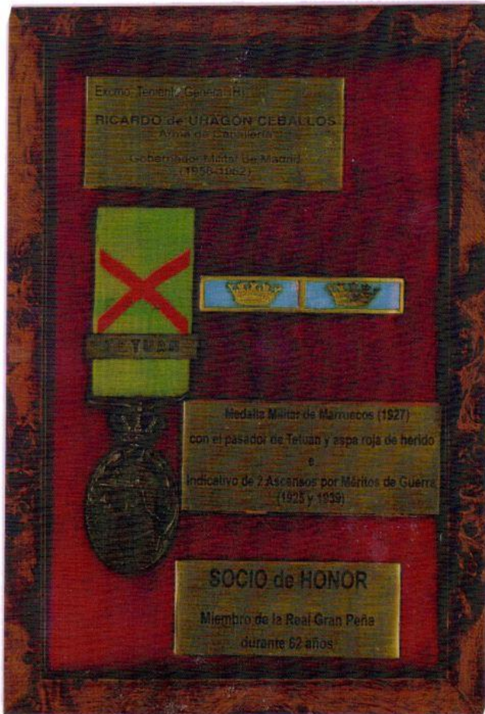
Placa que contiene la Medalla Militar de Marruecos con aspas de herido y pasador de Regulares de Tetuán , distintivos de dos ascensos por méritos de guerra y de nombramiento de Socio de Honor de la Gran Peña de Madrid.